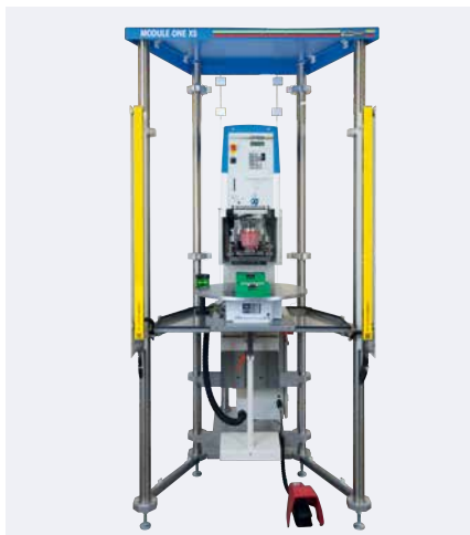
MODULE ONE XS mit Tampondruckmaschine HERMETIC 9-12-universal

Die MODULE ONE XS besteht grundsätzlich aus einem kompakten Gestell, einer Schutzumhausung sowie den vier standardisierten Bauteilen: Rundschtaltteller, Lichtvorhang, Winkeltisch und Kreuzsupport. Die Tampondruckmaschine selbst wird individuell aus den Maschinenserien HERMETIC, SEALED INK CUP E und V-DUO ausgewählt.