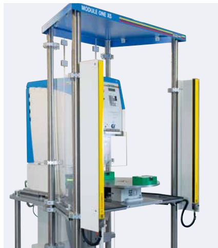
Lichtvorhang, Rundschtaltteller, Winkeltisch

Die MODULE ONE XS besteht grundsätzlich aus einem kompakten Gestell, einer Schutzumhausung sowie den vier standardisierten Bauteilen: Rundschtaltteller, Lichtvorhang, Winkeltisch und Kreuzsupport. Die Tampondruckmaschine selbst wird individuell aus den Maschinenserien HERMETIC, SEALED INK CUP E und V-DUO ausgewählt.