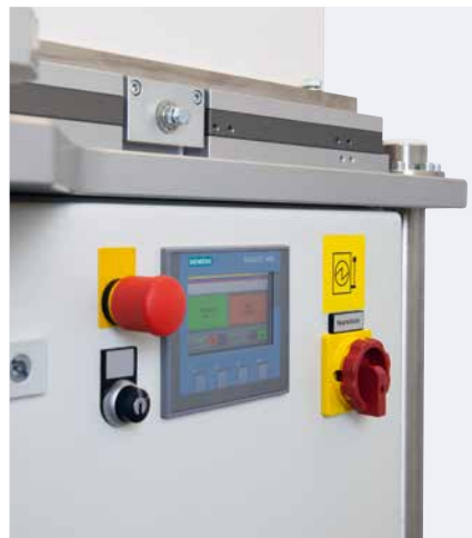
Touchpanel zur Bedienung des Schalttellers

Zusammen mit der praktischen Ablagefläche ermöglicht der höhenverstellbare Winkeltisch